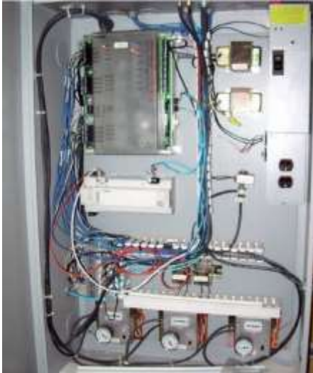
Figura 3. Los controles de la ventilación, como los dispositivos electrónicos y el PLC en el lado izquierdo de este tablero, pueden verse afectados por los armónicos de tal manera que generen un funcionamiento inadecuado del equipo controlado.

Aunque los variadores de frecuencia son ejemplos de cargas no lineales que causan muchos problemas de armónicos, otras fuentes de armónicos pueden ir desde fotocopiadoras en zonas de oficinas a una planta de los alrededores en la misma línea de suministro de la compañía eléctrica. Los efectos de armónicos en equipos de climatización pueden ocasionar paradas no deseadas de los controles o de los motores principales o averías en el transformador. Las comprobaciones iniciales mediante dos pinzas amperimétricas permiten identificar fácilmente posibles problemas con armónicos. No obstante, el analizador de la calidad eléctrica es la clave para medir, aislar y corregir los problemas con armónicos. Los modernos equipos de climatización requieren que ingenieros y técnicos entiendan la causa y el efecto de los armónicos, y sepan cómo medir e interpretar los valores de los armónicos si deben solucionarse problemas relacionados.