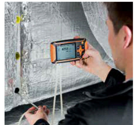
Medición con tubo de Pitot en el canal