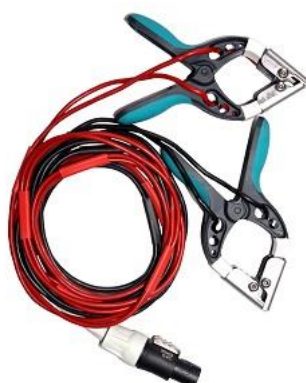
Cables de corriente y voltaje bobinado X lado de baja con pequeñas pinzas TTA