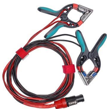
Cables de corriente y voltaje bobinado H lado de alta con pequeñas pinzas TTA

Todas estas especificaciones son válidas para una temperatura ambiente de +25 °C y con los accesorios estándar. Las especificaciones están sujetas a cambio sin previo aviso