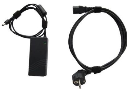
Fuente de poder CA