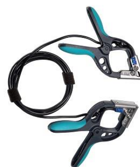
Cable cortocircuito con pequeñas pinzas TTA