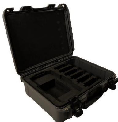
Caja de transporte de plástico para TWR-H, TRT-H & RMO-TH